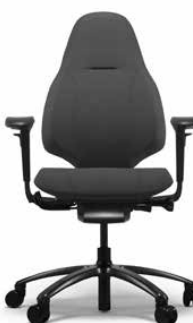
RH MERE0 220 BLACK

RH Mereo 200 har et medium ryglæn og leveres som standard med hjul til tæppebelagte gulve og et fodkryds i sortlakeret aluminium. Armlæn fås som tilvalg.