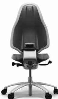
RH MERE0 220 SILVER

RH Mereo 220 har et højt ryglæn og leveres som standard med hjul til tæppebelagte gulve og et fodkryds i sortlakeret aluminium. Den kan udstyres med forskellige tilvalg, f.eks. nakkestøtte, armlæn og jakkebøjle.